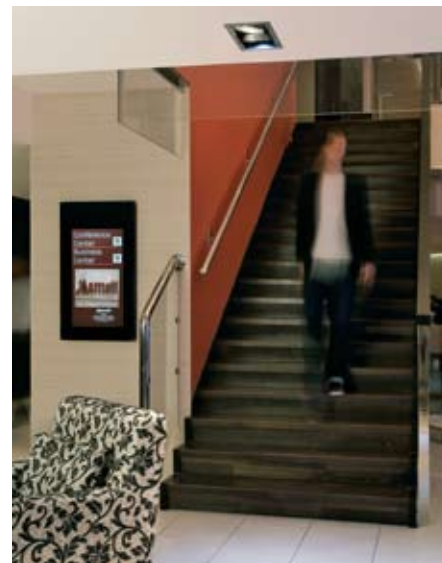
La finition soignée et discrète des écrans muraux convient bien à l'élégance du décor.