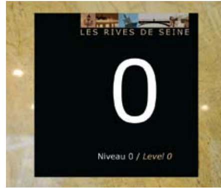
Les panneaux statiques et dynamiques diffusent une thématique graphique originale dans tout le bâtiment.